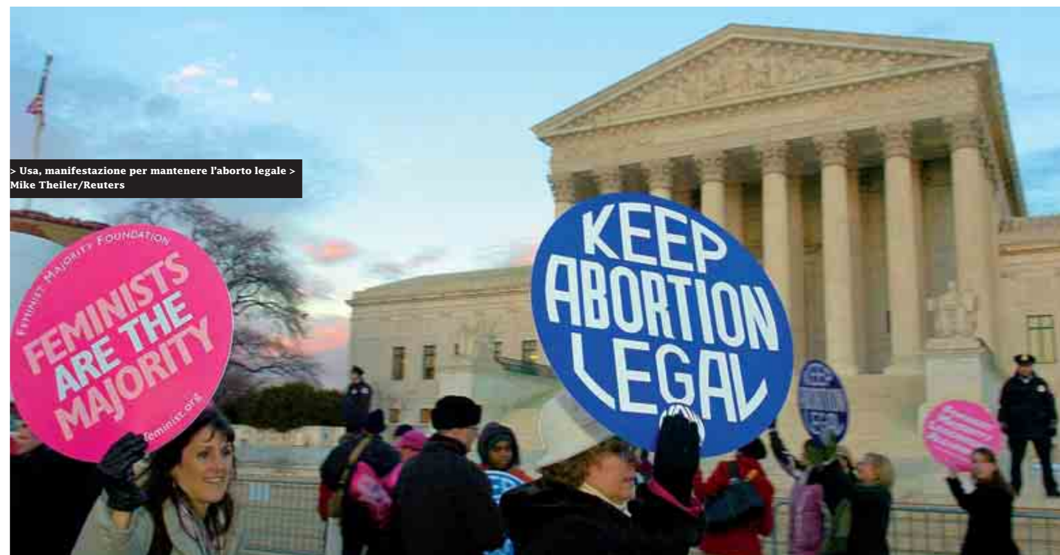
> Usa, manifestazione per mantenere l'aborto legale

Limitare i diritti delle donne a partire da quello alla salute, se comprende il diritto alla contraccezione, all'aborto legale, alla sessualità libera. Cancellare il concetto di "genere" e osteggiare la teoria lesbica perché decostruiscono la naturalità della ruolizzazione maschio-femmina. Collocare il valore della femminilità «nel cuore della famiglia». E' questo il filo nero che, al di là delle belle parole su dignità e uguaglianza, caratterizza l'attività del Vaticano alle Nazioni Unite, da Wojtyla a Ratzinger. Venerdì Benedetto XVI parla al Palazzo di Vetro